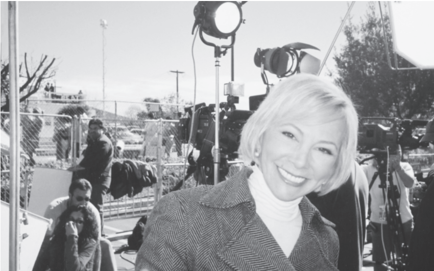
All'esterno del tribunale di Santa Maria, Marcia Clark, che era stata avvocato dell'accusa nel processo contro O.J. Simpson, si mostra felice di occuparsi del processo per il noto programma Entertainment Tonight.