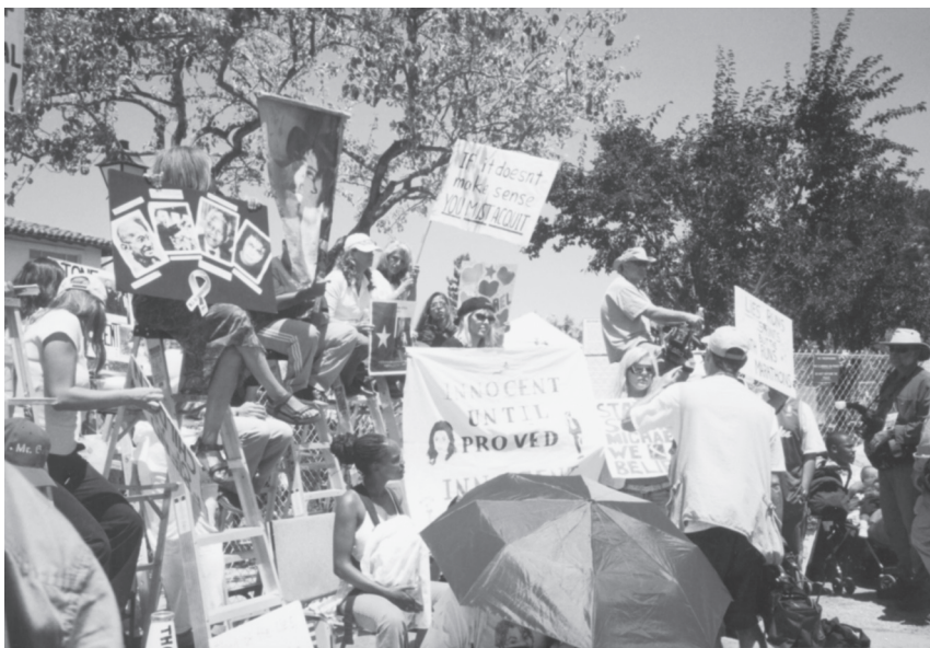
I fans di Michael Jackson erano fermamente convinti che il Re del Pop fosse vittima di un complotto.